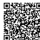
QR-Code Transponder- Bestellung