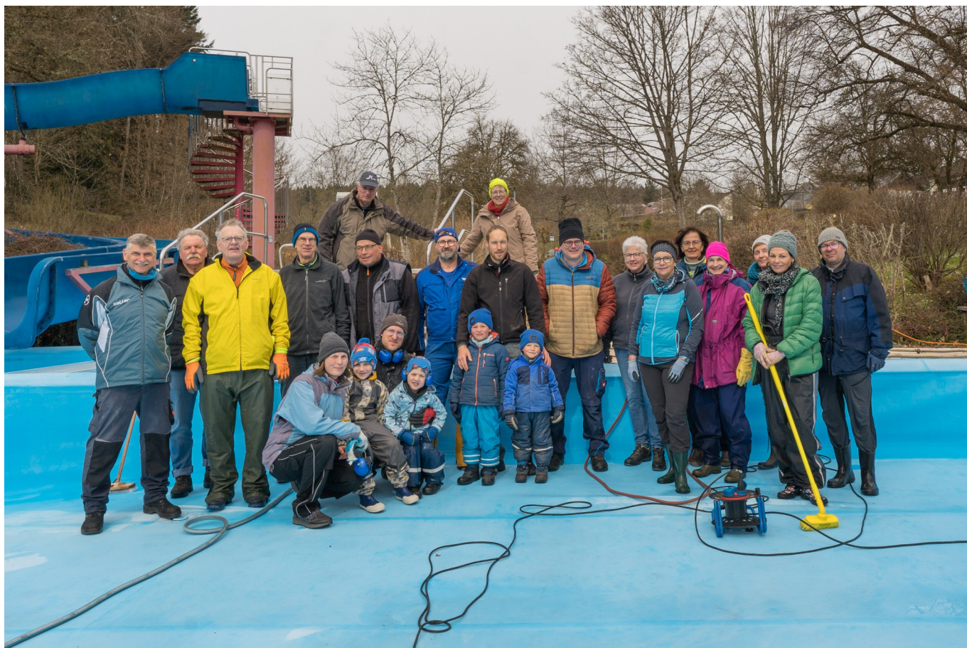
Gemeinsam angepackt: Viele freiwillige Helferinnen und Helfer unterstützten den Förderverein Loßburger Bäder bei der Grundreinigung der Becken.

Der Förderverein bedankt sich herzlich bei allen Helferinnen und Helfern. Ohne ihren Einsatz wären die umfangreichen Vorbereitungen für die kommende Badesaison nicht möglich.